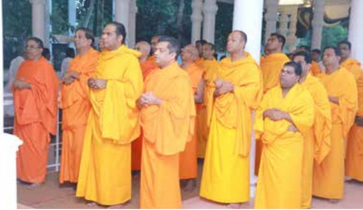
സന്യാസിമാരുടെ നേതൃത്വത്തിൽ നടന്ന പ്രാർത്ഥന