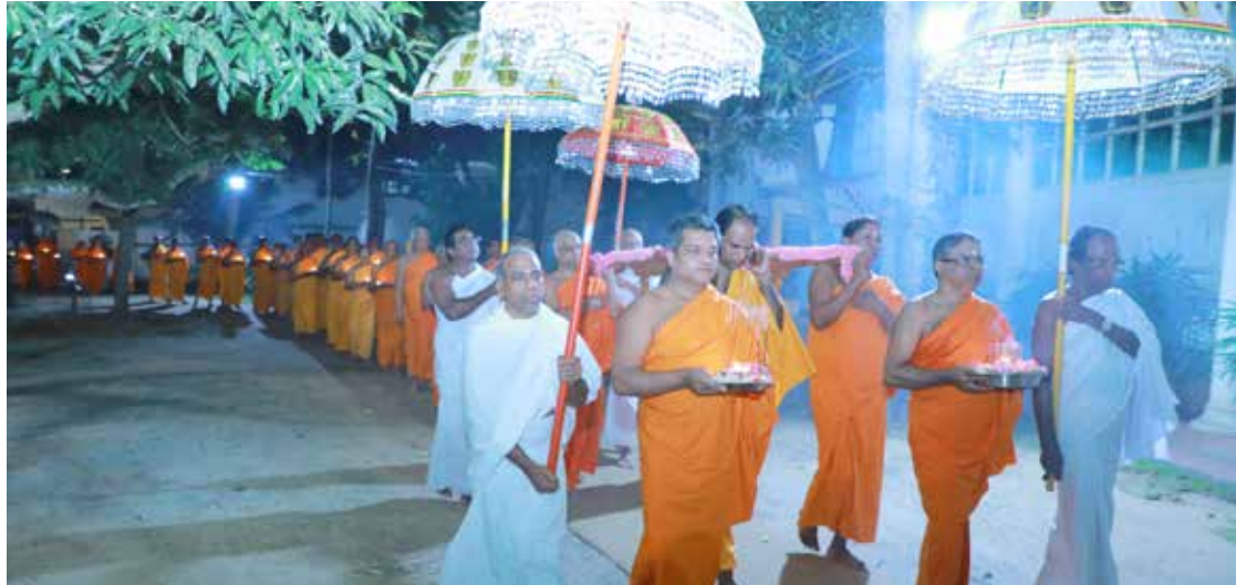
സന്യാസദീക്ഷാ വാർഷികദിനത്തിൽ നടന്ന ദീപം പ്രദക്ഷിണം

"നിങ്ങൾ ഓരോരുത്തരും അന്നോടന്നുള്ള ജീവിതത്തിന്റെ പണിക്കാരാണ്. അവന്റെ നഷ്ടം...ലാഭം...തൊഴിലാളി വർഗ്ഗത്തിന്റെ വേരുതോണ്ടുക... വേല ചെയ്യാതെ കുലി കൊടുപ്പിച്ച് മുതലാളിയുടെ വേരു തോണ്ടുക - നമുക്ക് ഉലകം പകർന്നു തന്ന അറിവ് ഇത്രമാത്രമാണ്."