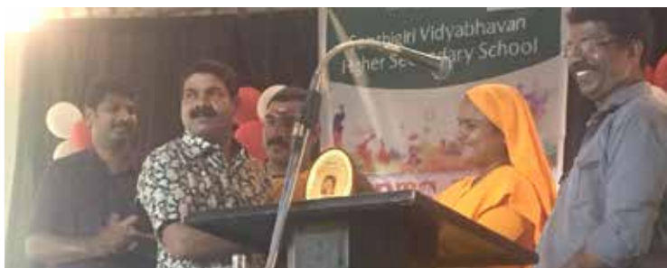
ആർട്സ് ഡേ ആഘോഷത്തിൽ നിന്ന്