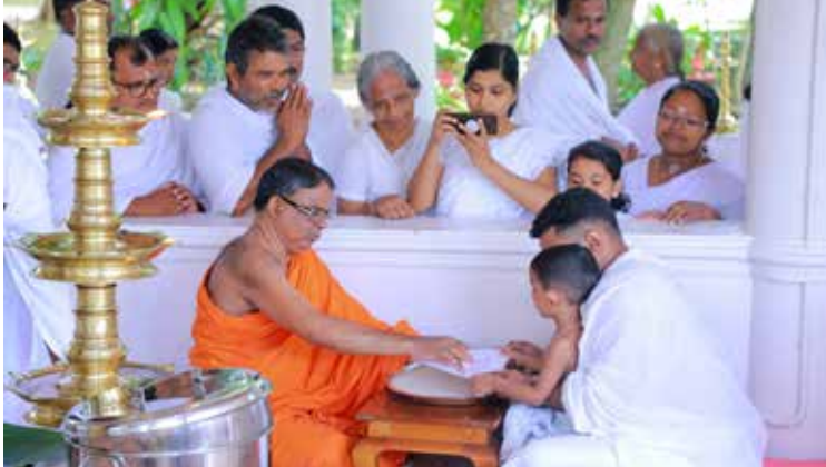
പ്രാർത്ഥനാലയത്തിൽ നടന്ന വിദ്യാരംഭം