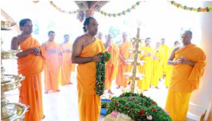
പർണ്ണശാലയിൽ നടന്ന ഹാരസമർപ്പണം