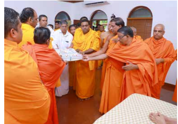
സമ്പൂർണ്ണ ഗുരുവാണി സമർപ്പണം

ഗങ്ങളും, ശാന്തിഗിരി കമ്മ്യൂണിക്കേഷൻസ് ഡിപ്പാർട്ട്മെന്റ് ചുമതലക്കാർ എന്നിവർ ചേർന്നാണ് ഗുരുവാണി പുസ്തകം സമർപ്പിച്ചത്. കോപ്പികൾ പബ്ലിക്കേഷൻസ് കൗണ്ടറിൽ ലഭ്യമാണ്. വില 600 രൂപ.