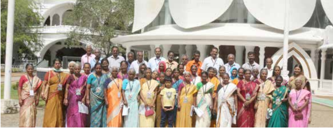
ആശ്രമം സന്ദർശിച്ച വയോജനസംഘം