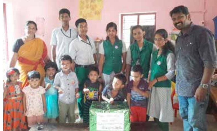
അങ്കണവാടിയിൽ നടന്ന എൻ.എസ്.എസ്. ദിനാഘോഷം

വാദ്യം, ചെണ്ടമേളം, ചിത്രരചന തുടങ്ങിയവയുടെ പുതിയ ക്ലാസ്സുകൾ ഒക്ടോബർ 8 ചൊവ്വാഴ്ച മുതൽ ആരംഭിക്കും. വിവരങ്ങൾക്കായി ബന്ധപ്പെടുക. 9847488614, 9961295748.