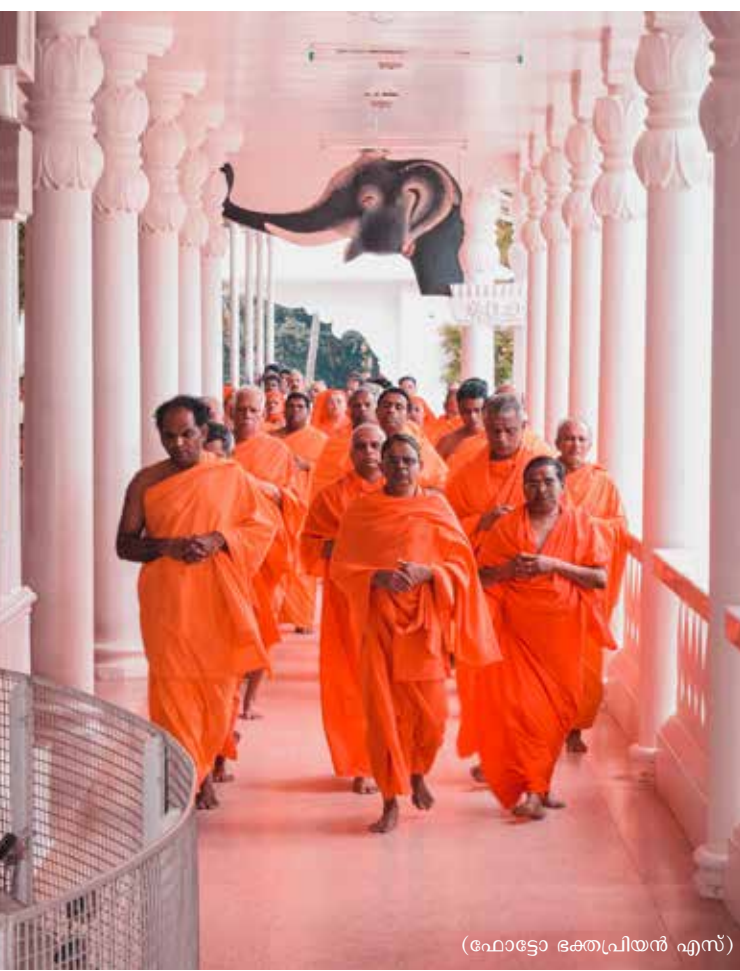
സന്യാസദീക്ഷ വാർഷികത്തോടനുബന്ധിച്ച് നടക്കുന്ന സങ്കല്പ പ്രാർത്ഥന

മേഖലയിലൂടെ തന്നെ കർമ്മമോചനം പ്രാപിക്കാം എന്നാണവർ പ്രത്യാശിക്കുന്നത്. ജീവിതസാഹചര്യത്തിന് ഗുരു നിർദ്ദേശിക്കുന്നതും കർമ്മമാണ്. ധർമ്മത്തിലൂന്നിയ കർമ്മത്തിലൂടെ സിദ്ധമാകുന്ന പുണ്യാശംകൊണ്ട് ഭൗതികപുഷ്ടിയും ആത്മതുഷ്ടിയും യാഥാർത്ഥ്യമാക്കാൻ കഴിയും. വിധിവിഹിതമായ കർമ്മാനുഷ്ഠാനങ്ങളിൽ ജാഗ്രതയോടെ മുഴുകി ഗുരുവിന്റെ പ്രകാശത്തിന് അവകാശിയായാൽ ഗുരു എന്ന അതിരുകളില്ലാത്ത അനുഭവത്തിന്റെ അവകാശിയാകാനും കഴിയും. കർമ്മമേഖലയിൽ അതിന്റെ സൂക്ഷ്മഭാവങ്ങളും മറ്റുപാധികളും ചേർന്ന് അദ്യശ്യമായ ഒരു പാരസ്പര്യം ഉണ്ട്. ആ പാരസ്പര്യമാണ് വിജയത്തിന്റെ അടിസ്ഥാനം. ലൗകികജീവികൾക്ക് അഷ്ടമിയും നവമിയും വിജയദശമിയുമാണ് പ്രധാനം. അഷ്ടമിക്ക് ആയുധങ്ങളും ഉപകരണങ്ങളും പുജയ്ക്കു വച്ച് മഹാനവമി പുജകൾക്കുശേഷം വിജയദശമി രാവിലെ വിദ്യാരംഭം. (ശേഷം മൂന്നാം പേജ്)