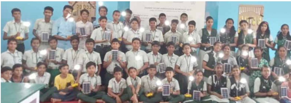
ശാന്തിഗിരി വിദ്യാഭവൻ വിദ്യാർത്ഥികൾ സോളാർ വിളക്കുമായി

വിക്കുകയാണ്. മാത്രമല്ല സ്വന്തം പരിമിതികളെയും നിരാസങ്ങളെയും നിരർത്ഥകമായ കെട്ടുപാടുകളെയും സത്യസാക്ഷാത്കാരത്തിന് തടസ്സമായ സംഗതികളെയും അനുയോജ്യമല്ലാത്ത ഇടങ്ങളെയും പരിത്യജിക്കുക. ഇതാണ് സന്യാസം. സന്യാസദീക്ഷാ വാർഷികത്തിന്റെ ഭാഗമായുള്ള 10 ദിവസത്തെ വ്രത സങ്കല്പങ്ങൾ സെപ്തംബർ 29 ഞായറാഴ്ച ആരംഭിച്ചു. രാവിലെയും വൈകുന്നേരവും പ്രത്യേക പ്രാർത്ഥനാസങ്കല്പങ്ങൾ നടന്നുവരുന്നു.