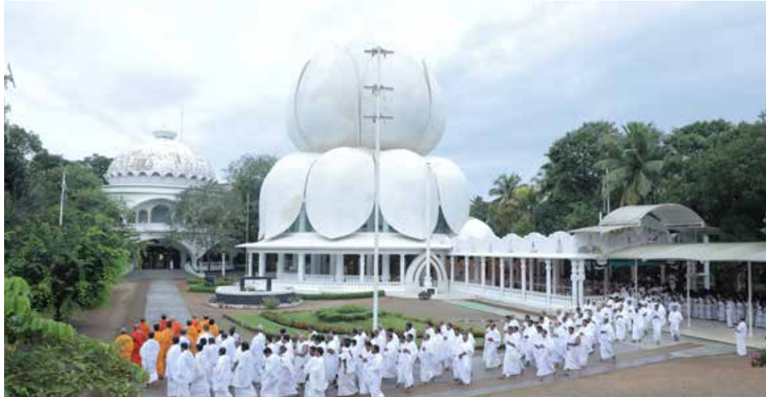
'നവപൂജിതം' ആഘോഷത്തോടനുബന്ധിച്ചുള്ള 21 ദിവസത്തെ പ്രത്യേക പ്രാർത്ഥന