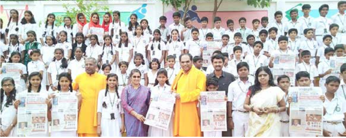
ശാന്തിഗിരി വിദ്യാഭവനിലെ മധുരം മലയാളം പദ്ധതി സ്വാമി ഗുരുരത്നം അനന്തപത്മി ഉദ്ഘാടനം ചെയ്യുന്നു