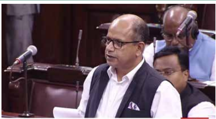
ആയുഷ് ചികിത്സാ വികസനത്തെക്കുറിച്ച് അമർ പട്നായിക്ക് രാജ്യസഭയിൽ സംസാരിക്കുന്നു