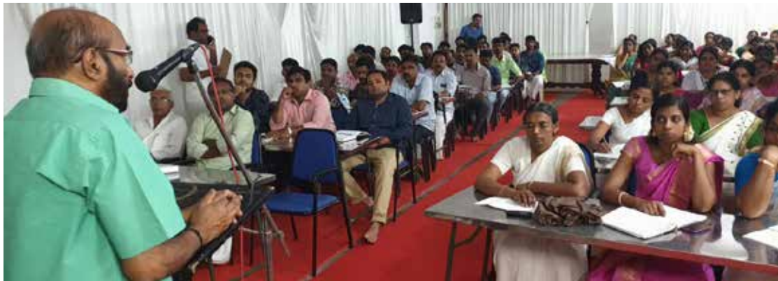
അക്കൗണ്ടന്റുമാർക്കായി നടത്തിയ ജിഎസ്ടി പരിശീലനക്ലാസ്

രെയുള്ള പ്ലക്കാർഡുകളേന്തിയ കുട്ടികൾ ലഹരി വിരുദ്ധ മുദ്രാവാക്യം, ലഹരി വിരുദ്ധ പ്രതിജ്ഞ എന്നിവ ചൊല്ലുകയും ചെയ്തു. ലഹരി വിരുദ്ധ പ്രവർത്തനങ്ങൾക്കുള്ള സംസ്ഥാന മദ്യ വർജ്ജന സമിതിയുടെ ഈ വർഷത്തെ പുരസ്കാരം ശാന്തിഗിരി വിദ്യാഭവന് ലഭിച്ചിരുന്നു.