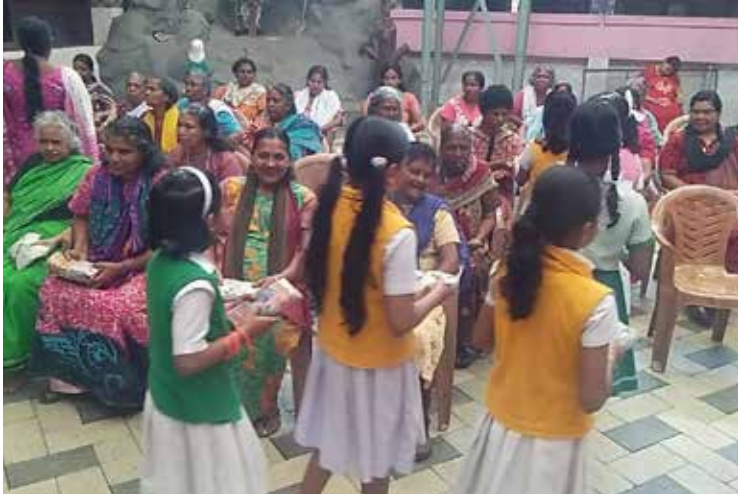
ശാന്തിഗിരി വിദ്യാഭവൻ സീനിയർസെക്കന്ററി സ്കൂളിന്റെ പാഥേയം പദ്ധതിയുടെ ഭാഗമായി പോത്തൻകോട് കരുണാലയത്തിലെ അന്തേവാസികൾക്ക് പൊതിച്ചോറ് നൽകുന്നു