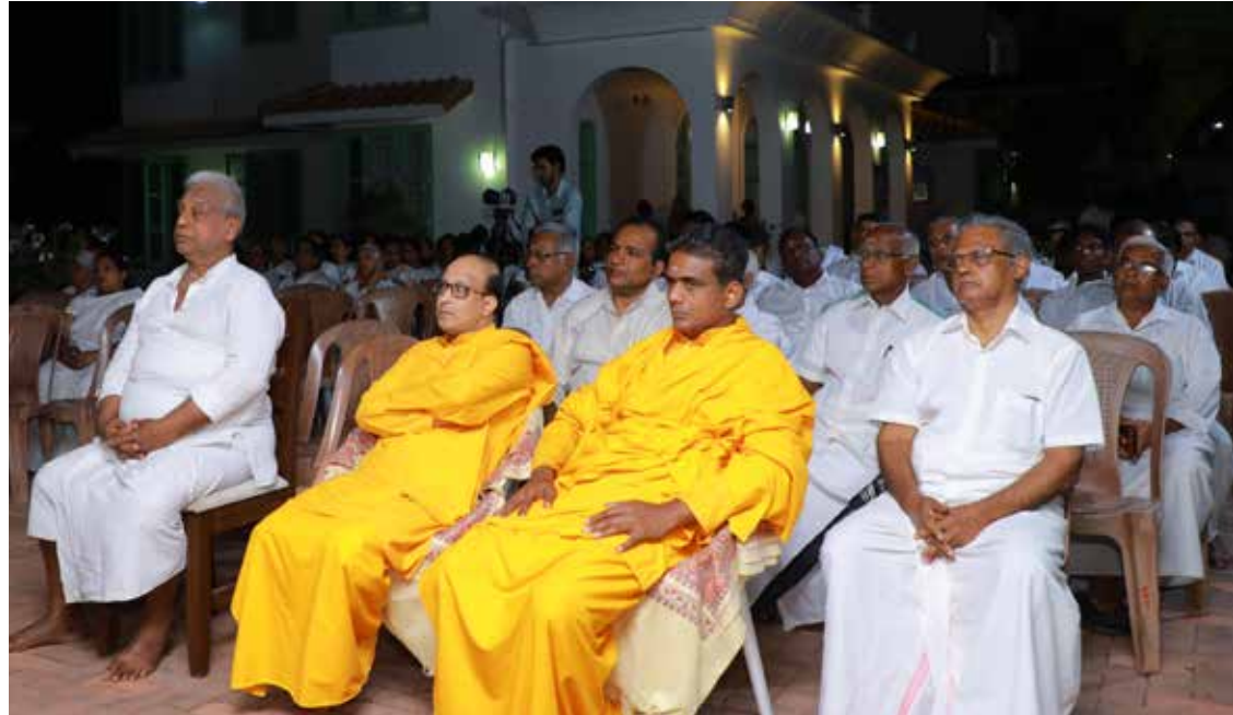
ആനന്ദപുരത്ത് ജനുവരി 31ന് നടന്ന പുജിതപീഠം സമർപ്പണം സത്സംഗസദസ്