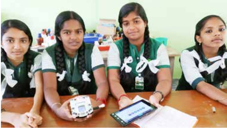
റോബോട്ടിക് എക്സിബിഷനിൽ നിന്ന്

പവിത്രമായ ജന്മഭൂമിയിലേക്ക് എത്തിച്ചേരേണ്ട ഒരു മഹാകർമ്മമാണ് ഗുരു അനുവദിച്ചനുഗ്രഹിച്ച ചോതി തീർത്ഥാടനം. പൂർവ്വജന്മ കർമ്മദോഷങ്ങളെക്കുറിച്ച് ജീവിതത്തിൽ പുണ്യവും ഭാഗ്യവും നിറയ്ക്കുന്ന ചോതി തീർത്ഥാടനത്തിൽ പങ്കെടുക്കുന്നതിനായി വിവിധ സംസ്ഥാനങ്ങളിൽ നിന്നും ജില്ലകളിൽ നിന്നുമായി എത്തിച്ചേരുന്ന തീർത്ഥാടകരുടെ എണ്ണം നാൾക്കു നാൾ വർദ്ധിച്ചുകൊണ്ടിരിക്കുകയാണ്.