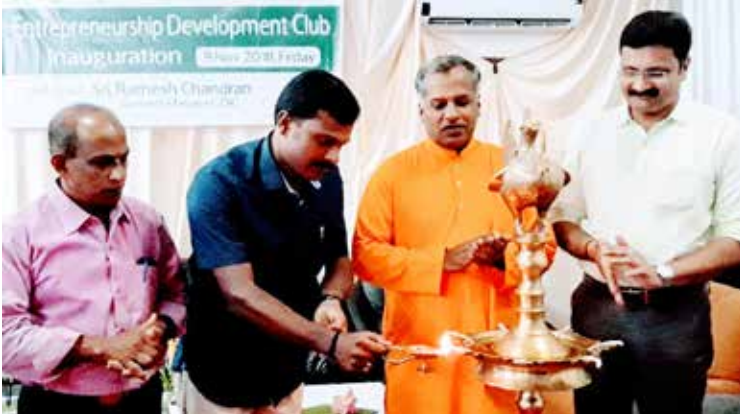
വ്യാവസായിക സംരംഭകത്വ ക്ലബ്ബ് ഉദ്ഘാടനം