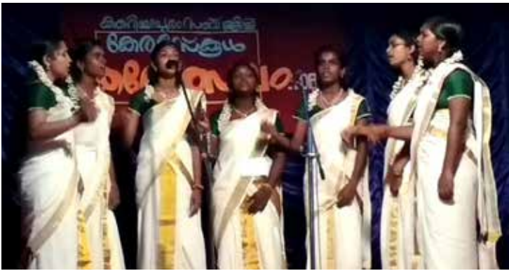
കന്യാകുളങ്ങര ജി.എച്ച്.എസ്.എസിൽ നടന്ന കണിയാപുരം ഉപജില്ലാകലോൽസവത്തിൽ എ ഗ്രേഡോടെ സംഘഗാനത്തിൽ ഒന്നാംസ്ഥാനം നേടിയ ശാന്തിഗിരി വിദ്യാഭവൻ ഹയർസെക്കന്ററി സ്കൂൾ ടീം