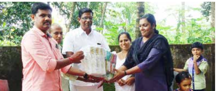
ശാന്തിഗിരി ഭഗിനിനികേതൻ ഉൽപ്പന്നങ്ങൾ കുടുംബശ്രീ യൂണിറ്റിന് കൈമാറുന്നു

പോത്തൻകോട്: ശാന്തിഗിരി ഭഗിനി നികേതൻ ഉത്പന്നങ്ങളായ കരിപൗഡറുകൾ, സോപ്പുകൾ, ചന്ദനത്തിരി, തേൻ, തുടങ്ങിയ ഉത്പന്നങ്ങൾ നേരിട്ട് വീടുകളിലേക്ക് എത്തിക്കുന്ന പ്രവർത്തനം കുടുംബശ്രീ യൂണിറ്റുകളുമായി ചേർന്ന് ആരംഭിച്ചു. പദ്ധതിപ്രകാരം വാങ്ങിക്കുന്ന ഉത്പന്നങ്ങൾക്ക് പരമാവധി മുപ്പത് ശതമാ