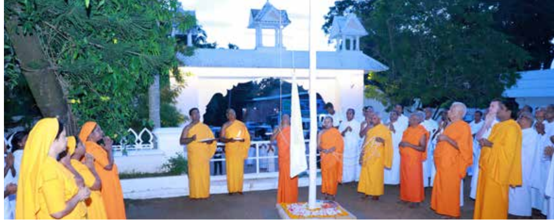
സാംസ്കാരിക ദിനത്തിൽ നടന്ന ധ്യാനോഹണ ചടങ്ങ്

സാക്ഷാൽ പരബ്രഹ്മമായ ഒരു കാലാന്തരഗുരുവിനെ ലഭിച്ചാലുള്ള മേന്മ മനുഷ്യമനസുകൾ വിഭാവനം ചെയ്യുന്ന തിനപ്പുറത്താണ്. ഈ സത്യം അനുഭവം കൊണ്ട് അറിഞ്ഞ ശിഷ്യപരമ്പരയാണ് ശാന്തിഗിരി പരമ്പര.