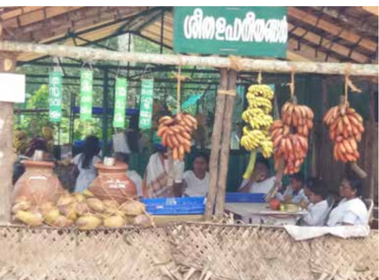
റിസർച്ച് സോണിലെ ശീതളപാനീയ സ്റ്റാൾ

പിരപ്പൻകോട്: പിരപ്പൻകോട് കൃഷി ഓഫീസിൽ നിന്ന് ആവശ്യക്കാർക്ക് സൗജന്യമായി കൃഷി ചെയ്യുന്നതിനുള്ള വൻ പയർ വിത്ത് ലഭ്യമാണ്. ഇതിനായി കരം തീർത്ത രസീത്, റേഷൻ കാർഡിന്റെ കോപ്പി എന്നിവ സഹിതം കൃഷി ഓഫീസിൽ എത്തിച്ചേരണം. സ്വന്തമായി പത്ത് സെന്റ് എങ്കിലും സ്ഥലമോ പാട്ടത്തിന് എടുത്ത സ്ഥലമോ ഉള്ളവർക്ക് മാത്രമേ വിത്ത് ലഭിക്കുകയുള്ളൂ.