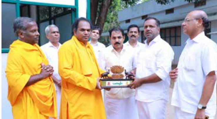
ആശ്രമം സന്ദർശിച്ച കർണാടക മന്ത്രി യു.റ്റി. ഖാദറിന് സ്വാമി ഗുരുരത്നം അനന്തപത്മി ഉപഹാരം സമ്മാനിക്കുന്നു