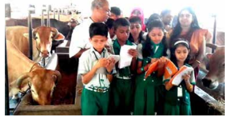
കുട്ടികൾ ആശ്രമം ഗോശാലയിൽ

എജ്യൂക്കേഷൻ സോൺ: ശാന്തിഗിരി വിദ്യാഭവൻ സീനിയർ സെക്കന്ററി സ്കൂൾ മാതൃഭൂമി സീഡ് ക്ലബിന്റെ ആഭിമുഖ്യത്തിൽ ആശ്രമത്തിലെ ഗോശാലയിലേക്ക് വിദ്യാർത്ഥികളുടെ പഠനയാത്ര നടന്നു. ജൈവ വൈവിധ്യ സംരക്ഷണ പ്രോജക്റ്റിന്റെ ഭാഗമായാണ് പഠനയാത്ര സംഘടിപ്പിച്ചത്. പശു സംരക്ഷണ കർമ്മങ്ങൾ, ക്ഷീരോൽപാദനം, പാലുല്പന്നങ്ങളുടെ നിർമ്മാണം, ബയോ ഗ്യാസ് തുടങ്ങി വിവിധ വിഷയങ്ങളെക്കുറിച്ച് കുട്ടികൾ റിപ്പോർട്ട് തയ്യാറാക്കി. ഗോശാലയിലെ