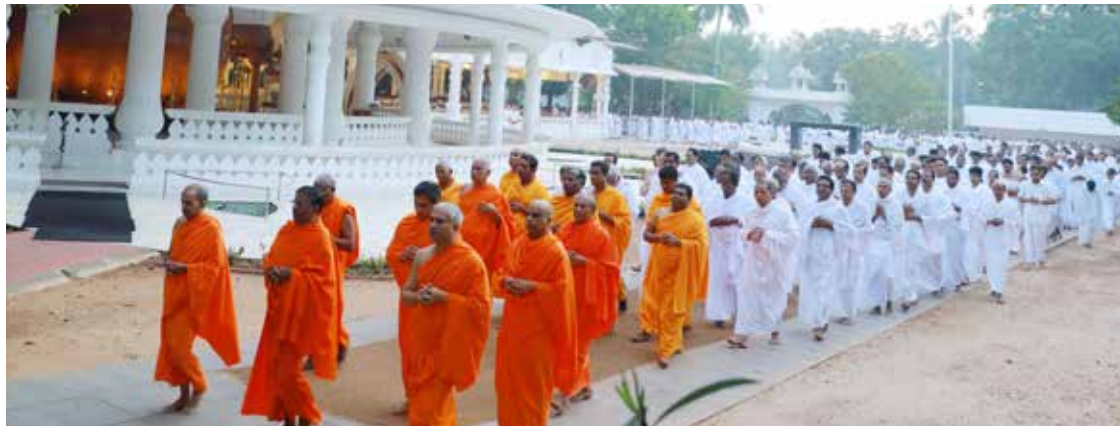
പുജിതപീഠം സമർപ്പണം വ്രതസങ്കല്പങ്ങൾക്ക് ശനിയാഴ്ച ആശ്രമത്തിൽ തുടക്കമായപ്പോൾ

സ്പിരിച്ചൽ സോൺ: പുജിതപീഠം സമർപ്പണം ആഘോഷങ്ങളുടെ വ്രതസങ്കല്പങ്ങൾ ശനിയാഴ്ച ആരംഭിച്ചു. കേന്ദ്ര ശ്രമത്തിലും വിവിധ ബ്രാഞ്ച് ആശ്രമങ്ങളിലും ഇനി നാൽപ്പത്തൊന്നു നാൾ പ്രത്യേക പ്രാർത്ഥനാസങ്കല്പങ്ങളും പുഷ്പസമർപ്പണവും ഉണ്ടായിരിക്കും. രാവിലെ ആറുമണിക്ക് ആരാധനയ്ക്ക് ശേഷമാണ് പുഷ്പസമർപ്പണം നടക്കുക. ഒരു പ്രാവശ്യം അവസ്ഥനാമവും സങ്കല്പവും ചൊല്ലി പുഷ്പം സമർപ്പിച്ച് പർണശാലയിലും സഹകരണമന്ദിരത്തിലും പ്രാർത്ഥനാലയത്തിലും ഒരു തവണ പ്രദക്ഷിണം വച്ച് സമർപ്പിക്കും. ഗുരുശിഷ്യബന്ധത്തിന്റെ മഹനീയത വിളംബരം ചെയ്യുന്ന പുണ്യദിനമാണ് ശാന്തിഗിരി പരമ്പര ഓരോ ഫെബ്രുവരി 22 നും ആഘോഷിക്കുന്ന പുജിതപീഠം സമർപ്പണദിനം. ഗുരുവിന്റെ ത്യാഗജീവി