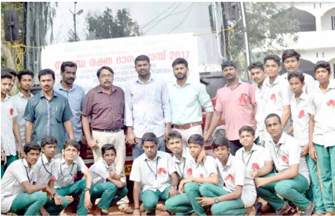
ശാന്തിഗിരി വിദ്യാഭവൻ ഹയർ സെക്കന്ററി സ്കൂൾ എൻ.എസ്.എസ് യൂണിറ്റ് സംഘടിപ്പിച്ച രക്തദാന ക്യാമ്പിൽ നിന്ന്