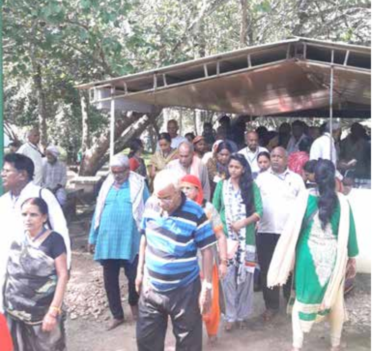
നവംബർ 23 ന് എത്തിയ 'ഭാരതദേശൻ' യാത്രികർ ആശ്രമത്തിൽ