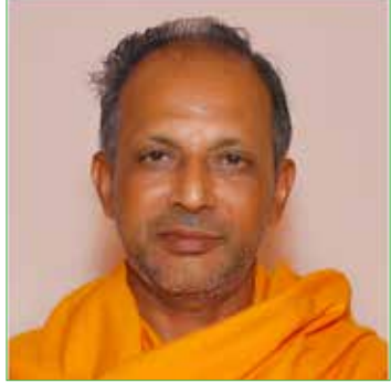
സ്വാമി മഹിതൻ ജ്ഞാനതപസ്വി