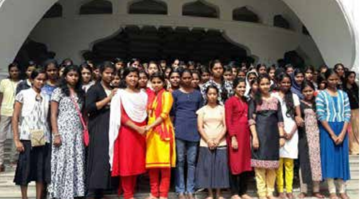
ആശ്രമം സന്ദർശിച്ച ഇരിങ്ങാലക്കുട ഗവ. ഹയർ സെക്കന്ററി സ്കൂളിലെ വിദ്യാർത്ഥികൾ സഹകരണമന്ദിരത്തിനു മുന്നിൽ