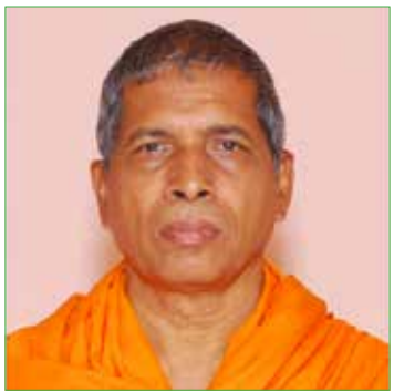
സ്വാമി പരിപൂർണ്ണ ജ്ഞാനതപസ്വി