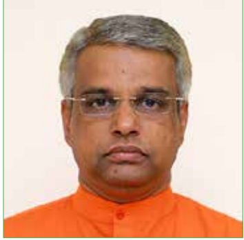
സ്വാമി നവനന്മ ജ്ഞാനതപസ്വി