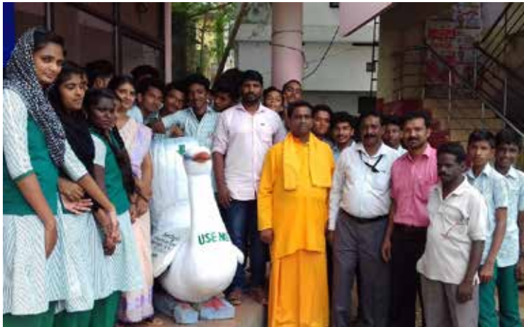
വെഞ്ഞാറമൂട് കെ.എസ്.ആർ.ടി.സി. ബസ് സ്റ്റാൻഡിൽ ശാന്തിഗിരി വിദ്യാഭവൻ വിദ്യാർത്ഥികൾ സ്ഥാപിച്ച വെയ്സ്റ്റ് ബിൻ

വെഞ്ഞാറമൂട്: മാലിന്യശേഖരണത്തിനും നിർമ്മാജനത്തിനും എൻ.എസ്.എസ് യൂണിറ്റിന്റെ ആഭിമുഖ്യത്തിൽ നവീന മാതൃകയൊരുക്കി ശാന്തിഗിരി വിദ്യാഭവൻ വിദ്യാർത്ഥികൾ. പൊതുസ്ഥലങ്ങളിൽ മാലിന്യങ്ങൾ വലിച്ചെറിയുന്നത് നിരുത്സാഹപ്പെടുത്തുന്നതിനുവേണ്ടി ശാന്തിഗിരി വിദ്യാഭവൻ ഹയർ സെക്കന്ററി സ്കൂളിലെ നാഷണൽ സർവീസ് സ്കീം വോളണ്ടിയർമാർ വെഞ്ഞാറമൂട് കെ.എസ്.ആർ.ടി.സി ബസ് സ്റ്റേഷനിൽ, വേസ്റ്റ് ബിൻ സ്ഥാപിച്ചുകൊണ്ടാണ് മാതൃകയായത്.