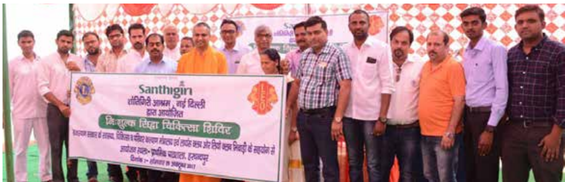
രാജസ്ഥാനിലെ ഭിവാഡിയിൽ ശാന്തിഗിരി ആശ്രമം, രാജസ്ഥാൻ സർക്കാരുമായി ചേർന്ന് സംഘടിപ്പിച്ച സിദ്ധ മെഡിക്കൽ ക്യാമ്പിൽ നിന്ന്