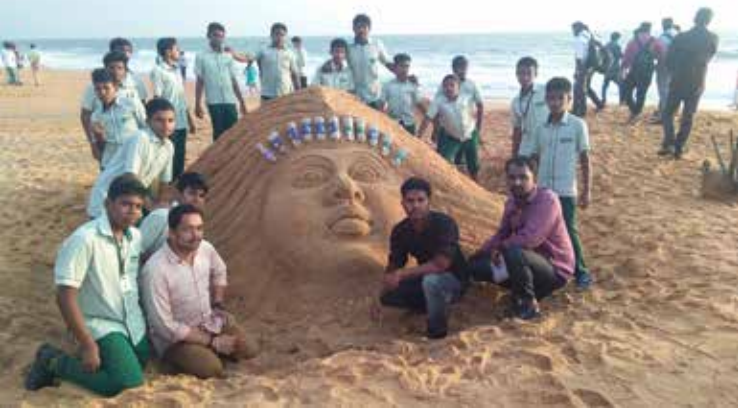
ശംഖുമുഖം ബീച്ചിൽ ശാന്തിഗിരി വിദ്യാഭവൻ വിദ്യാർത്ഥികൾ ഒരുക്കിയ 'പ്ലാസ്റ്റിക് യക്ഷി' മണൽശില്പം