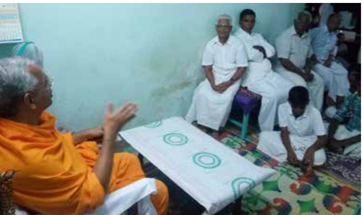
ശാന്തിഗിരി ജംഗ്ഷൻ യൂണിറ്റ് പ്രാർത്ഥനായോഗത്തിൽ നിന്ന്

ലോകമൊട്ടാകെയുള്ള വിവിധ മതപണ്ഡിതന്മാരും ആത്മീയനേതാക്കളും ഉൾപ്പെടെ അയ്യായിരത്തോളം പ്രതിനിധികൾ ഒക്ടോബർ 12 മുതൽ അഞ്ച് ദിവസം നീണ്ട കോൺഫ്രൻസിൽ പങ്കെടുത്തു. ക്രിസ്ത്യൻ കോൺഫ്രൻസ് ഓഫ് ഏഷ്യയാണ് പരിപാടി സംഘടിപ്പിച്ചത്. തായ്‌ലണ്ട് ആസ്ഥാനമായ ഈ സംഘടനയുടെ വജ്രജൂബിലി ആഘോഷങ്ങളുടെ ഭാഗമായിട്ടാണ് ഏഷ്യ മിഷൻ കോൺഫ്രൻസ് സംഘടിപ്പിച്ചത്.