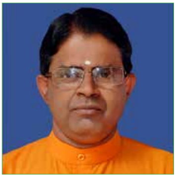
സ്വാമി ചൈതന്യ ജ്ഞാനതപസ്വി