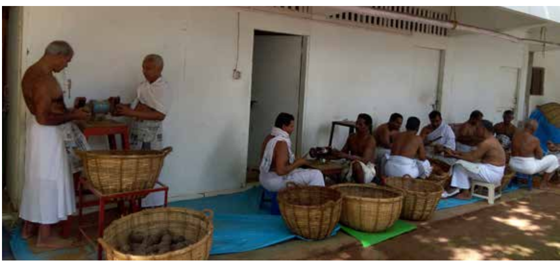
കുండമേളയ്ക്കുള്ള കുണ്ടും ഒരുക്കുന്ന ആത്മബന്ധുക്കൾ

മുതലുള്ള ആത്മീയചരിത്രം ഗങ്ങളെ സ്വാശീകരിക്കുകയും തിരുത്തുകയും ചെയ്യുന്ന കർമ്മമെന്നും കുండമേളയെ വിളിക്കാം. മനുപരമ്പരയ്ക്ക് തെറ്റുപറ്റിയാൽ ബ്രഹ്മതന്നെ അതേ റെടുത്തു പ്രവർത്തിക്കും. ഇത് ആ നിശ്ചയത്തിന്റെ കരുതലാണ്. ഗുരുവിന്റെ ജന്മപരമ്പരകളിലെ ത്യാഗസഹനങ്ങളുടെ പ്രതീകാത്മകമായ പുനരാവർത്തനം ഗുരുവിന്റെ ഈ ജീവിതത്തിൽ സംഭവിച്ചു. അതിന്റെ പുണ്യസാന്ദ്രമായ മുഹൂർത്തങ്ങളാണ് ഗുരുവിന്റെ ആത്മീയ അവസ്ഥാപൂർത്തീകരണങ്ങളിലൂടെ പ്രകാശിച്ചത്. ആ അവസ്ഥകളുടെ സമ്പൂർണ പൂർത്തീകരണം 1973 കന്നി നാലാം തീയതി സംഭവിച്ചു. അതിൽ സംതുപ്തി പ്രകടിപ്പിച്ചുകൊണ്ട് ബ്രഹ്മത്തിൽ നിന്നും അറിയിപ്പുണ്ടായി: "ഞാൻ യുഗാന്തരങ്ങളായി ആഗ്രഹിച്ചിരുന്ന കാര്യം ഇന്നു പൂർത്തിയായി." ഈ സുദിനം നിത്യസ്മരണാർഹമായതിനാൽ അത് ലോകോത്തരമായ ഉത്സവവും ഭക്തിയുടെ സമാരോഹ