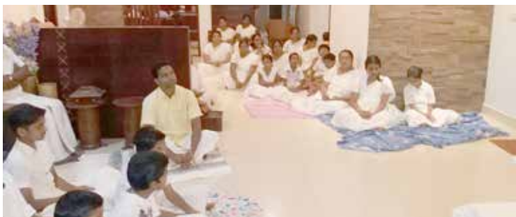
ലക്ഷ്മിപുരം യൂണിറ്റ് പ്രാർത്ഥനായോഗം