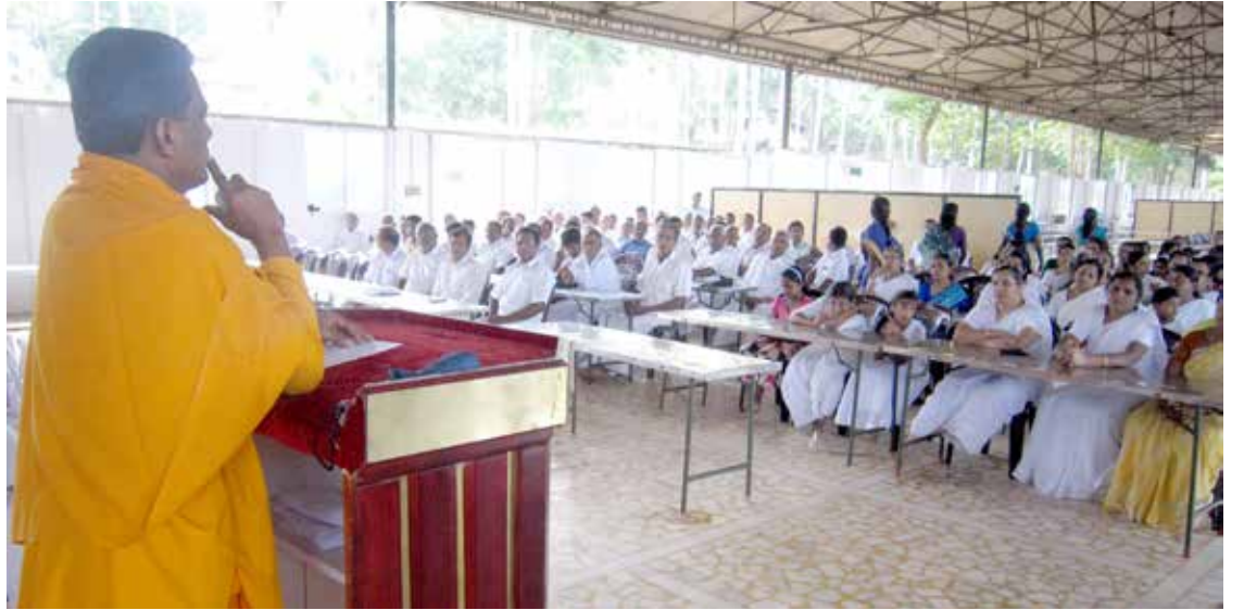
ഗൃഹസ്ഥാശ്രമസംഘം പൊതുയോഗത്തിൽ നിന്ന്