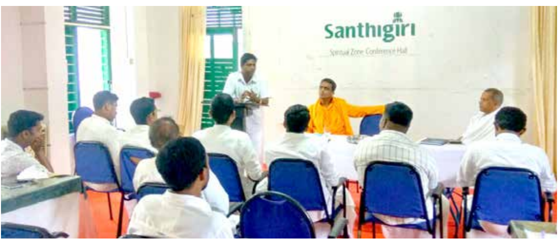
ശാന്തിമഹിമ ഗവേണിങ് കമ്മിറ്റി യോഗം

(ദൈവസന്ദേശം പകുവയ്ക്കുന്ന നിമിഷാർദ്ധങ്ങൾ - അഭിവന്ദ്യ ശിഷ്യപുജിതയുടെ പ്രഭാഷണത്തിൽ നിന്ന്)