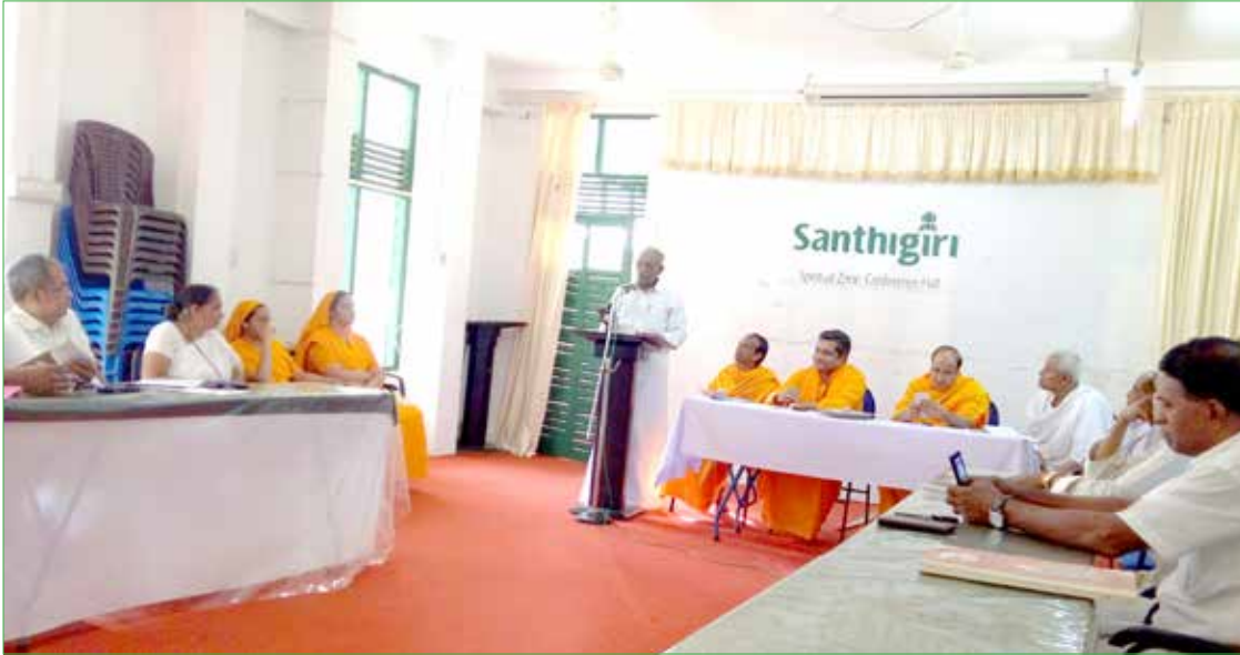
ശ്രീൻ പ്രോട്ടോക്കോൾ ഹൈ പവർ കമ്മിറ്റി യോഗം