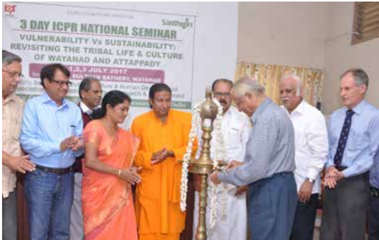
ശാന്തിഗിരി റിസർച്ച് ഫൗണ്ടേഷൻ സെമിനാർ ഉദ്ഘാടനം