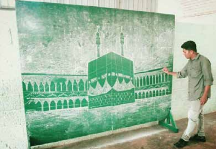
വിദ്യാഭവനിലെ നിസ്കാര സ്ഥലം