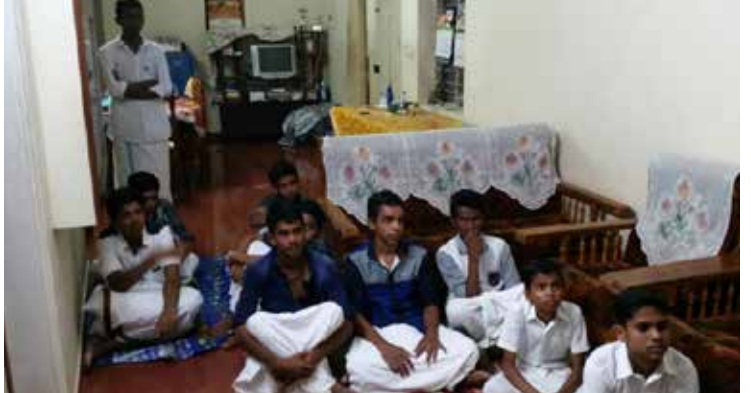
ശാന്തിമഹിമ സത്സംഗത്തിൽ നിന്ന്