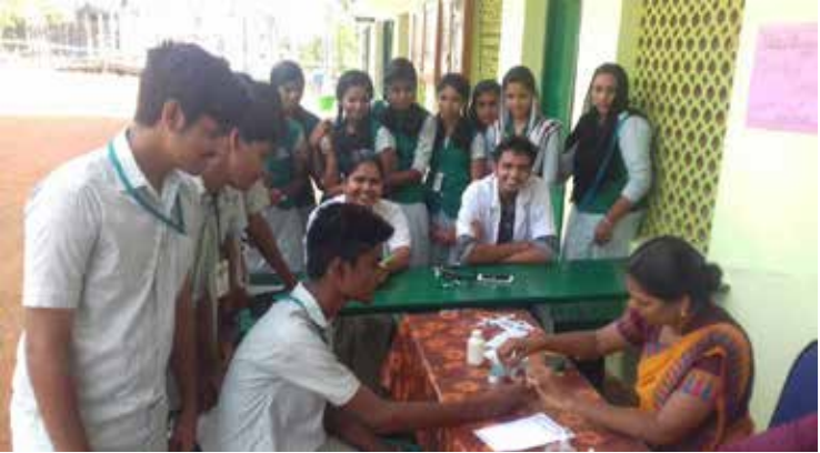
രക്തഗ്രൂപ്പ് നിർണ്ണയ ക്യാമ്പിൽ നിന്ന്

ന്നതാണ്. പഴയ കാർഡ്, വാങ്ങുന്നയാളിന്റെ ഐഡന്റിറ്റി കാർഡിന്റെ കോപ്പി എന്നിവ സഹിതം എത്തിച്ചേരണം. പൊതുവിഭാഗത്തിന് 100 രൂപയും മുൻഗണനാ വിഭാഗത്തിന് 50 രൂപയുമാണ് ഫീസ്. കാർഡിൽ ഉൾപ്പെട്ടയാൾ തന്നെ കാർഡ് വാങ്ങാൻ എത്തേണ്ടതാണ്.