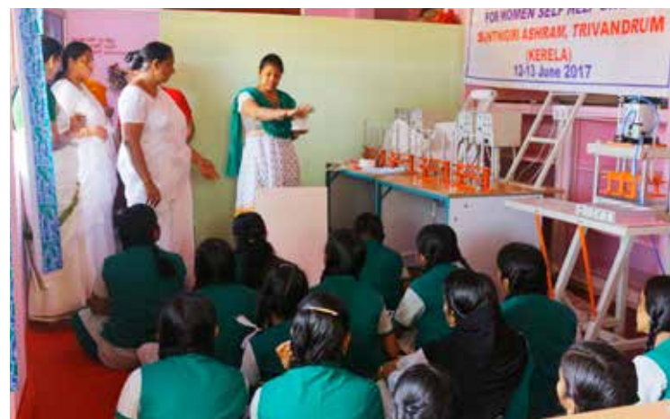
ന്യൂഡെൽഹിയിൽ നിന്നുള്ള സുലഭ ഇന്റർനാഷണൽ പ്രതിനിധി സാനിറ്ററി നാപ്കിൻ നിർമ്മാണ പരിശീലന ക്ലാസ് നയിക്കുന്നു