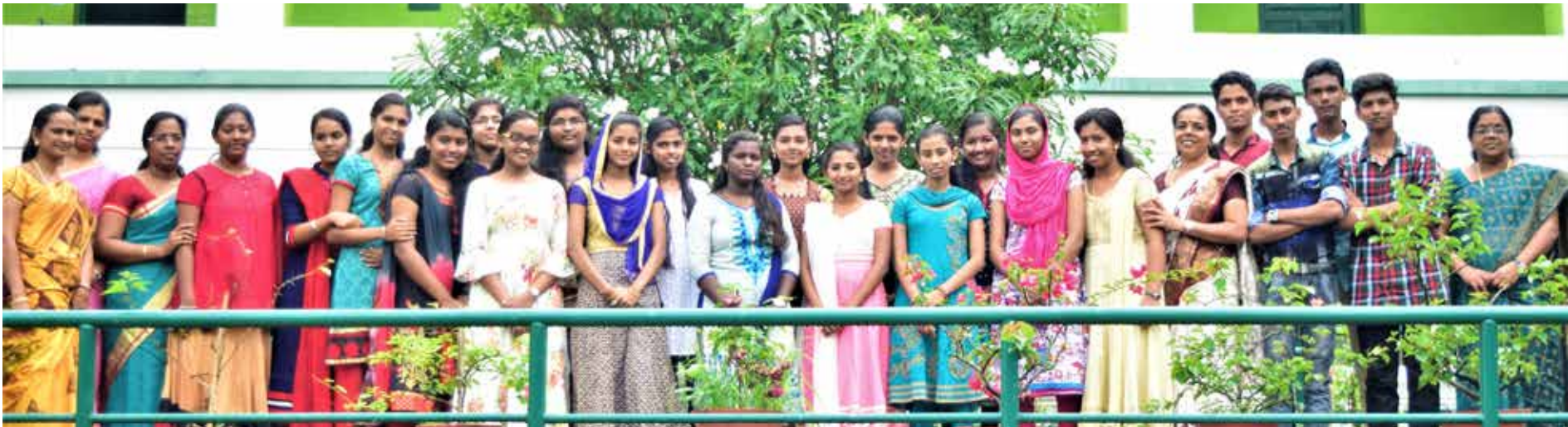
ശാന്തിഗിരി വിദ്യാഭ്യാസ സീനിയർ സെക്കന്ററി സ്കൂളിൽ നിന്ന് സിബിഎസ്ഇ പത്താം ക്ലാസ് പരീക്ഷയിൽ എ പ്ലസ് നേടിയ വിദ്യാർത്ഥികൾ അദ്ധ്യാപകരോടൊപ്പം