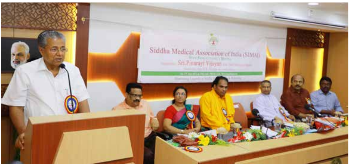
സിദ്ധ പ്രതിനിധി സമ്മേളനം തിരുവനന്തപുരത്ത് മുഖ്യമന്ത്രി പിണറായി വിജയൻ ഉദ്ഘാടനം ചെയ്യുന്നു