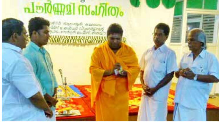
പൗർണ്ണമിദിനരാത്രിയിൽ അതിൽ നടന്ന സംഗീതാർച്ചന

സ്പിരിച്ചൽ സോൺ: ഇടവമാസ പൗർണ്ണമി ജൂൺ 8 ന് ദക്ഷിണിർദരമായി ആഘോഷിച്ചു. രാവിലെ അഞ്ചു മണി മുതലുള്ള വിവിധ ആരാധനകൾക്കും പ്രാർത്ഥനാസങ്കല്പങ്ങൾക്കുമായി നൂറുകണക്കിനു ഗുരുഭക്തർ വ്രതനിഷ്ഠയോടെ ആശ്രമത്തിലെത്തി. പുഷ്പസമർപ്പണം, തട്ടം സമർപ്പണം, ദീപം-കുംഭം പ്രദക്ഷിണം, സംഗീതാർച്ചന എന്നിവയും ആഘോഷ പരിപാടികളെ ഭക്തിസാന്ദ്രമാക്കി.