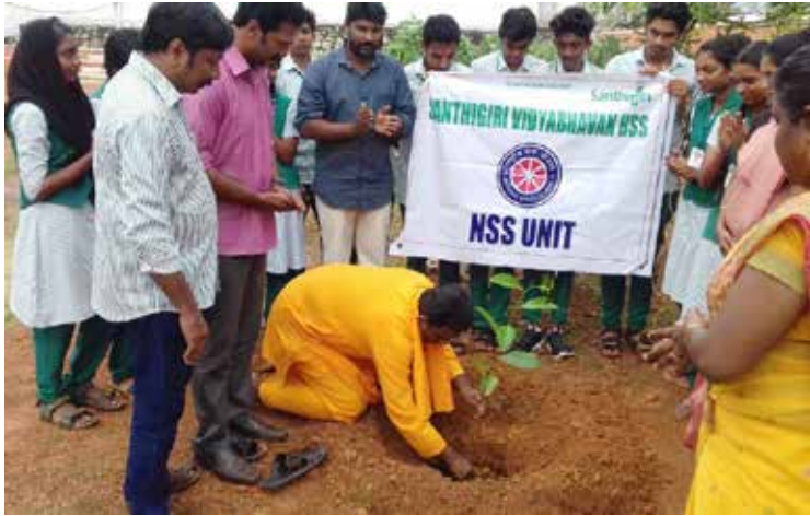
ശാന്തിഗിരി വിദ്യാഭവൻ എച്ച്എസ്എസ് പരിസ്ഥിതിദിനാഘോഷം