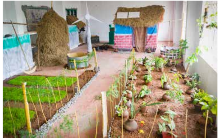
സിദ്ധ കോളേജ് അവതരിപ്പിച്ച ഇക്കോ ഫ്രണ്ട്ലി ഭവനമാതൃക

ശാന്തിഗിരി ശാന്തിമഹിയുടെ നേതൃത്വത്തിൽ പാലോട്ടുകോണം ഏരിയയിൽ വൃക്ഷത്തെ വിതരണം നടന്നു. ആദ