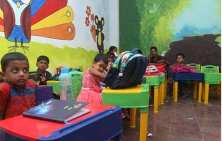
ശാന്തിഗിരി വിദ്യാഭവൻ പ്രവേശനോത്സവത്തിൽ നിന്ന്

ക്കാത്ത കക്കൂസുകളുടെ ഫ്ളഷ് ടാങ്കുകൾ, ക്ലോസറ്റുകൾ എന്നിവയിൽ കൊതുകുകൾ മുട്ടയിടാനുള്ള സാഹചര്യം ഏറെയാണ്. അതിനാൽ അവ നന്നായി മുടിയിടണം. വീടിനോടു ചേർന്ന കക്കൂസിലും പലപ്പോഴും ഡെങ്കിപ്പനി പരത്തുന്ന കൊതുകുകളെ കണ്ടെത്തിയിട്ടുണ്ട്. അതിനാൽ അതീവ ജാഗ്രത വേണം. സോപ്പ് പെട്ടിയുടെ അപ്പിനുള്ളിൽ തങ്ങിനില്ക്കുന്ന ഏതാനും തുള്ളി വെള്ളത്തിലും ഈഡിസ് കൊതുക്കുകൾ മുട്ടയിടാം. രാത്രിയും പകലും കൊതുകിന്റെ കടിയേൽക്കാതെ സൂക്ഷിക്കണം. കൃഷിയിടങ്ങളിൽ പണിയെടുക്കുന്നവരും യാത്ര ചെയ്യുന്നവരും കൊതുകു കടിയേൽക്കാതെ സൂക്ഷിക്കുക. ശരീരം പൂർണ്ണമായും മുടിയിടക്കുന്ന വസ്ത്രം ധരിക്കുക. കൊതുകുവല ഉപയോഗിക്കുക എന്നീ മുൻകരുതലുകൾ എടുക്കണം.