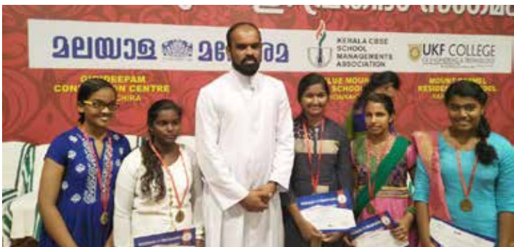
മലയാള മനോരമയുടെ സിബിഎസ്ഇ പ്രതിഭാസംഗമത്തിൽ പങ്കെടുത്ത ശാന്തിഗിരി വിദ്യാഭവൻ വിദ്യാർത്ഥികൾ

ആശ്രമത്തിന്റെ വിവിധ ഏരിയ ഓഫീസുകളുടെ നേതൃത്വത്തിലും സംസ്ഥാനത്തിന്റെ വിവിധ ഭാഗങ്ങളിൽ പരിസ്ഥിതിദിനാചരണം നടന്നു.