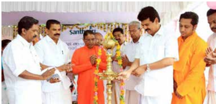
ശാന്തിഗിരി ആയുർവേദ സിദ്ധ ഹോസ്പിറ്റലിന്റെ ഉദ്ഘാടനം ജോയ്സ് ജോർജ് എം.പി. നിർവ്വഹിക്കുന്നു

കുട്ടപ്പന: ആതുരസേവനമേഖലയിൽ ശാന്തിഗിരിയുടെ സേവനങ്ങൾ സ്മൃതകൃതം എന്ന് അഡ്വ. ജോയ്സ് ജോർജ് എം.പി. കുട്ടപ്പനയിൽ ശാന്തിഗിരി ആയുർവേദ സിദ്ധഹോസ്പിറ്റലിന്റെ ഉദ്ഘാടനം നിർവ്വഹിച്ച സംസാരിക്കുകയായിരുന്നു അദ്ദേഹം. ഭാരതീയ ചികിത്സാവിഭാഗങ്ങളായ ആയുർവേദത്തിനും സിദ്ധത്തിനും അർഹമായ പ്രാധാന്യം നൽകുന്നതിനും രാജ്യവ്യാപകമായി പ്രചരിപ്പിക്കുന്നതിലും ശാന്തിഗിരിയുടെ സംഭാവന വളരെ വലുതാണ്. കേരളത്തിൽ മാത്രമല്ല പുറത്തും ശാന്തിഗിരിയുടെ പ്രവർത്തനങ്ങൾ മാതൃകാപരമായ രീതിയിലാണ് നടക്കുന്നത്. ന്യൂഡൽഹിയിലെ ആശ്രമത്തിന്റെ പ്രവർത്തനങ്ങളിൽ ഇപ്പോഴും പങ്കാളിയാകുവാനും കഴിയുന്നത് തന്റെ ഭാഗ്യമായി കരുതുന്നുവെന്നും എം.പി.