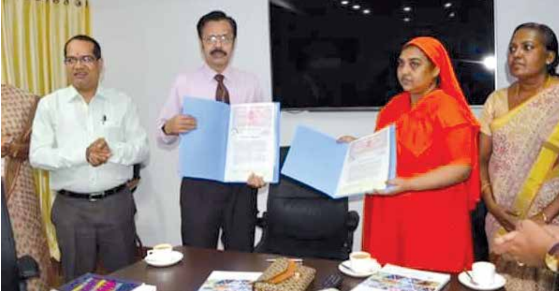
സിദ്ധ ഗവേഷണത്തിനുള്ള ധാരണാപത്രം ഒപ്പുവയ്ക്കൽ ചടങ്ങ്

തിരുവനന്തപുരം: കേന്ദ്ര ആയുഷ് മന്ത്രാലയത്തിനു കീഴിലുള്ള സെൻട്രൽ കൗൺസിൽ ഫോർ സിദ്ധ റിസർച്ച് ഇൻസ്റ്റിറ്റ്യൂട്ടും തിരുവനന്തപുരം രാജീവ് ഗാന്ധി സെന്റർ ഫോർ ബയോടെക്നോളജിയും സിദ്ധ ഗവേഷണരംഗത്ത് ശാന്തിഗിരി ഹെൽത്ത്കെയർ ആന്റ് റിസർച്ച് ഓർഗനൈസേഷനുമായി ധാരണാപത്രത്തിൽ ഒപ്പിട്ടു.