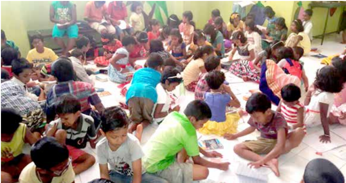
ഗുരുകാന്തി അവധിക്കാല പഠനക്യാമ്പിൽ നിന്ന്

എജ്യൂക്കേഷൻ സോൺ: ഏപ്രിൽ മുനിന് ആരംഭിച്ച ശാന്തിഗിരി ഗുരുകാന്തിയുടെ അവധിക്കാല ക്യാമ്പ് കുട്ടികളിൽ ആവേശം ഉണർത്തുന്നതും ആനന്ദകരമായ പുതിയ അനുഭവമായി മാറുന്നു. എല്ലാവരും അറിവിന്റെയും ആനന്ദത്തിന്റെയും ഉത്സവലഹരിയിൽ തന്നെ. അവധി ദിവസമായ ഞായറാഴ്ചകളിൽ പോലും ഗുരുകാന്തിയിൽ വരുവാനായി വാശി പിടിച്ചു കരയുന്ന കുറുമ്പുക്കളുമുണ്ട് കൂട്ടത്തിൽ. രണ്ടാം ശതാബ്ദ പതിവു പോലെ നടത്തി വരുന്ന ഗുരുദർശനവും തട്ടസമർപ്പണവും ക്യാമ്പിന്റെ മഹനീയ മുഹൂർത്തമായിരുന്നു.