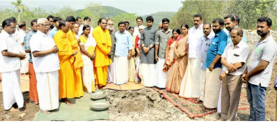
അഗ്രികൾച്ചർ സോണിൽ നടന്ന പ്ലാസ്റ്റിക് റീസൈക്ലിംഗ് പ്ലാന്റ് ശിലാസ്ഥാപനചടങ്ങ്