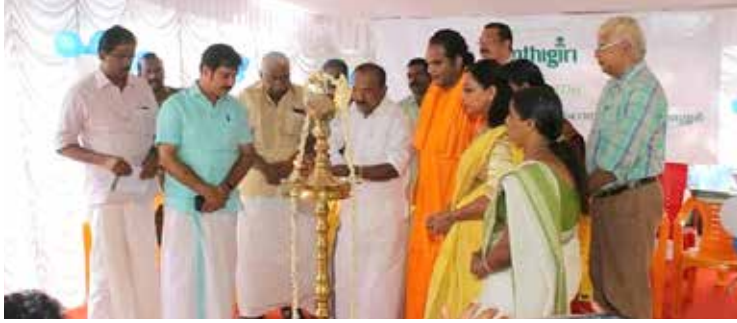
എരമല്ലൂർ ശാന്തിഗിരി ആശുപത്രി ഉദ്ഘാടനച്ചടങ്ങിൽ