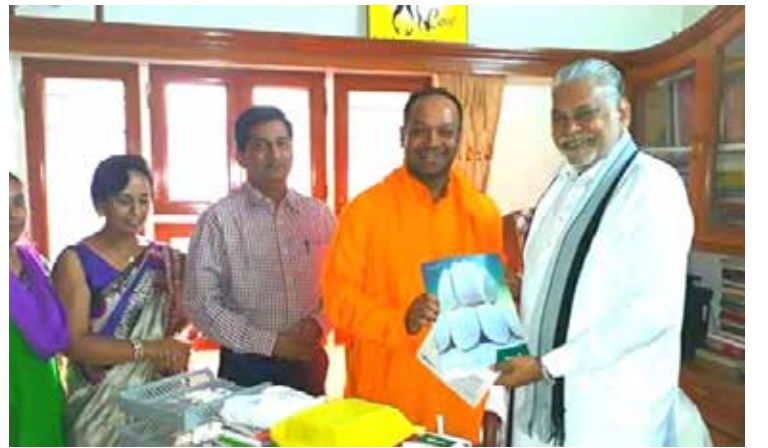
കേന്ദ്രമന്ത്രി പുരൂഷോത്തമ രൂപലയെ സ്വാമി ജനനന്ദ അനന്തപ്രസാദ് സന്ദർശിച്ചപ്പോൾ