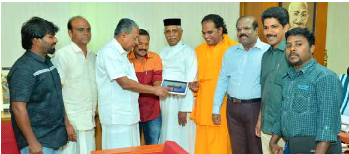
'വഴികാട്ടി' ലഹരിവിരുദ്ധ പദ്ധതി മുഖ്യമന്ത്രി പിണറായി വിജയൻ ഉദ്ഘാടനം ചെയ്യുന്നു

തിരുവനന്തപുരം : ലഹരി ഉപയോഗം പരിപൂർണ്ണമായി അവസാനിപ്പിക്കുക എന്ന ലക്ഷ്യം മുൻനിർത്തി ചലച്ചിത്രനടൻ മമ്മൂട്ടി ചെയർമാനായ കെയർ & ഷെയർ ഇന്റർനാഷണൽ ഫൗണ്ടേഷൻ, ശാന്തിഗിരി ആശ്രമം, ഡോ.വർഗീസ് മൂലൻ ഫൗണ്ടേഷൻ എന്നീ സംഘടനകളുടെ സംയുക്ത ആഭിമുഖ്യത്തിൽ വഴികാട്ടി ലഹരി വിരുദ്ധ പദ്ധതിയുടെ ഒന്നാംഘട്ടത്തിന് തുടക്കമായി. സംസ്ഥാന ആഭ്യന്തര വകുപ്പിന്റേയും വിദ്യാഭ്യാസ വകുപ്പിന്റേയും സമ്പൂർണ്ണ സഹകര