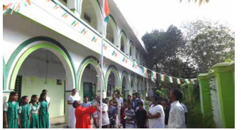
ശാന്തിഗിരി വിദ്യാഭവനിലെ റിപ്പബ്ലിക് ദിനാഘോഷം